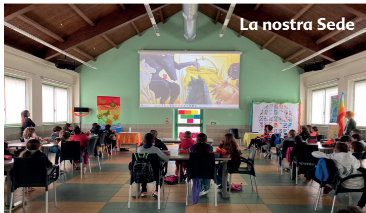
La nostra Sede

L'O.A.S.I. impegna giovani e adulti che, durante l'anno, sensibilizzano e coinvolgono molte altre persone nelle attività di volontariato. Le sue sorgenti economiche sono: l'autotassazione di tutti i volontari , che non solo non percepiscono retribuzione alcuna, ma provvedono essi stessi al proprio mantenimento, i campi di lavoro, le mostre artigianali, gli spettacoli, le giornate di sensibilizzazione con allestimento di bancarelle, le raccolte di metalli, la vendita di calendari, le offerte di tanti amici che credono nell'impegno sincero dei volontari. Operare in gruppo genera "gesti di vita" , benessere interiore e concrete possibilità di intervento a favore di bambini, malati e bisognosi. Attualmente i membri dell'O.A.S.I. sono impegnati soprattutto in Italia ed in Brasile e ovunque vi siano necessità che, in qualche modo, ritengano di voler e poter aiutare.